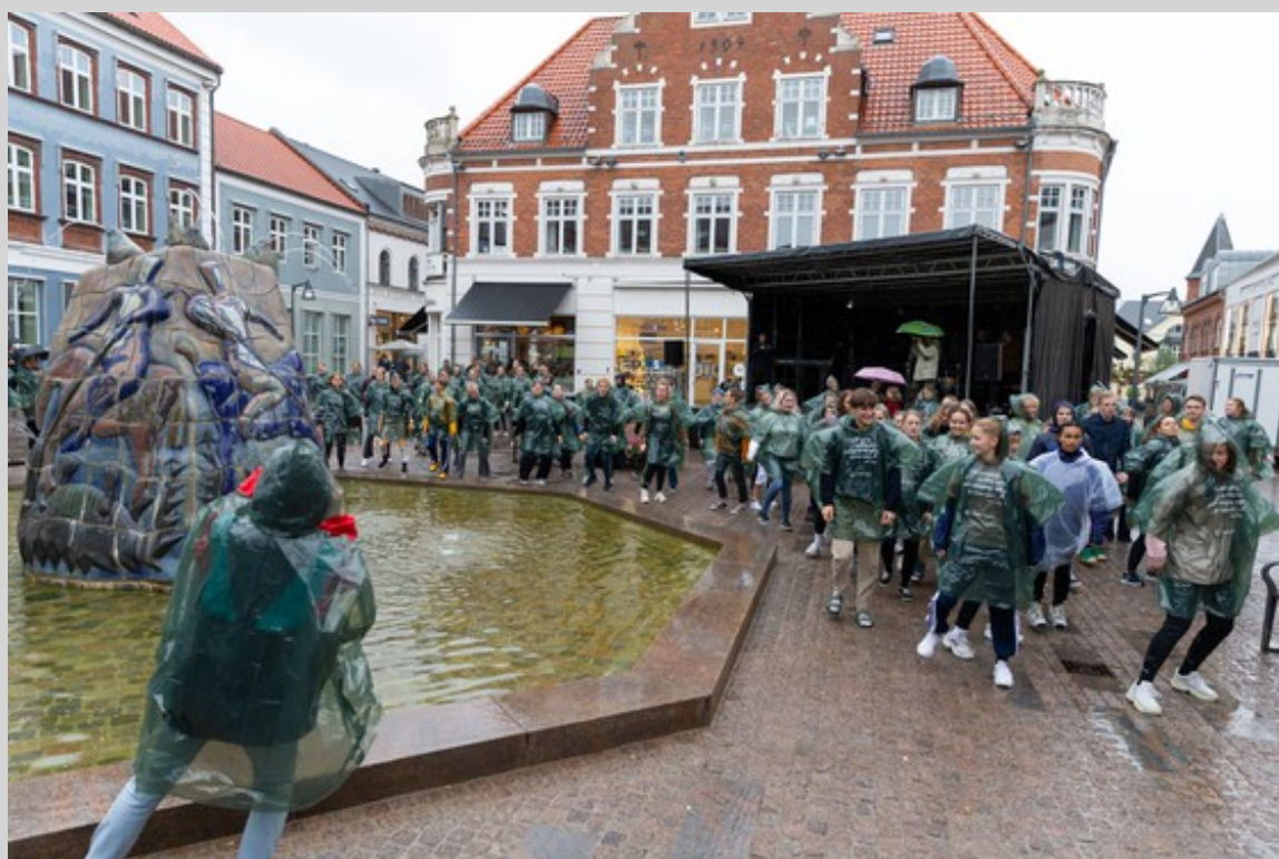
Foto:talenttræffet ShowUp i Holstebro 2019.